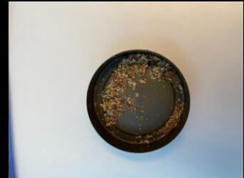
Bilder fra Indre Østfold politistasjon